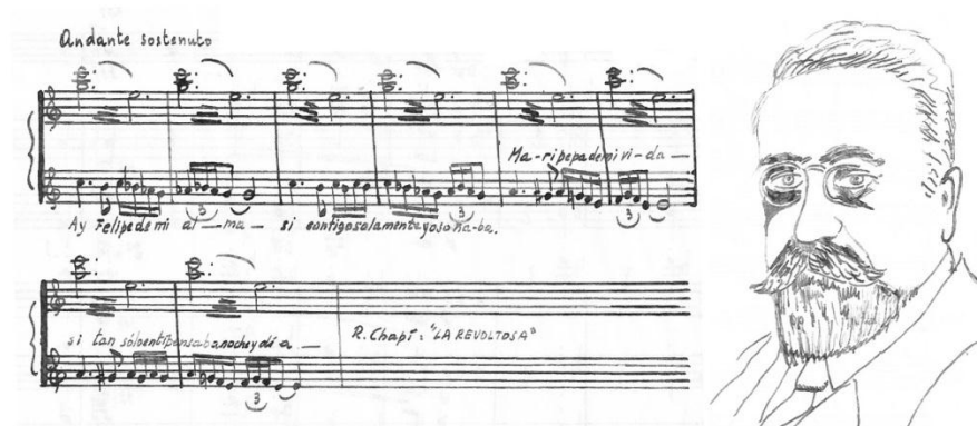
Figura 3. Imágenes de la última página de la partitura original.

Hacia el final, el motivo principal del primer movimiento es utilizado de una forma muy peculiar, considerando la estética general del compositor: las seis primeras notas se combinan con su complemento para formar el total cromático. El autor nos lo aclara anotando en su partitura manuscrita "serie dodecafónica, por si a alguien le interesa".